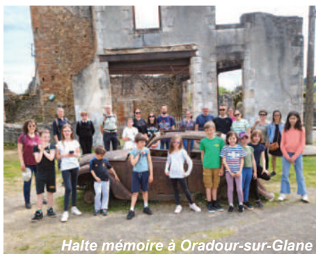
Halte mémoire à Oradour-sur-Glane

Le dernier week-end d'avril, la SLVie de la Lozère a organisé un voyage au Futuroscope. Le premier jour, nous avons fait un détour pour visiter le village martyr d'Oradour-sur-Glane, haut lieu symbolique de la barbarie nazie en France, durant la 2 ème Guerre Mondiale, pour un devoir de mémoire. La journée s'est terminée dans le repaire des pirates pour nous restaurer et une chasse au trésor qui a ravi les enfants. Le samedi,