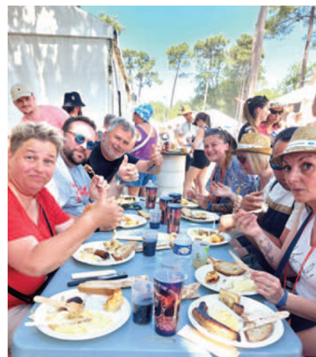
Les festivaliers se régalaient