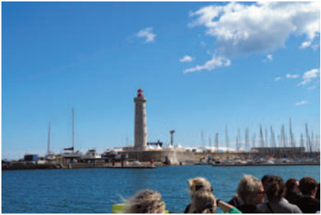
Le phare du port