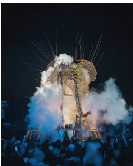
Les « machines » animées assurent le show