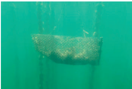
Elevage de coquillages