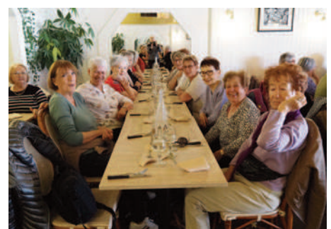
Bon appétit mesdames !