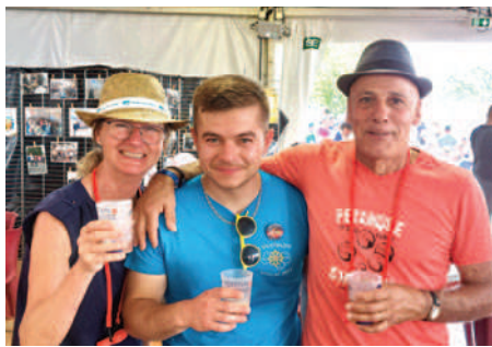
Un Festival intergénérationnel