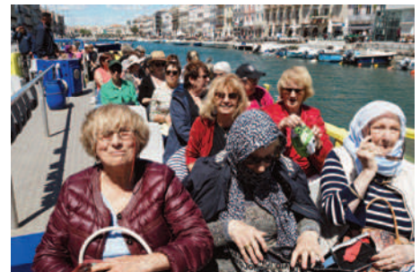
La croisière s'amuse