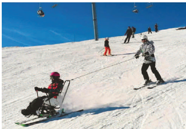
Moment de partage et de complicité entre un père et sa fille