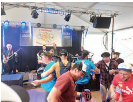
L'Oustalou, un lieu de convivialité