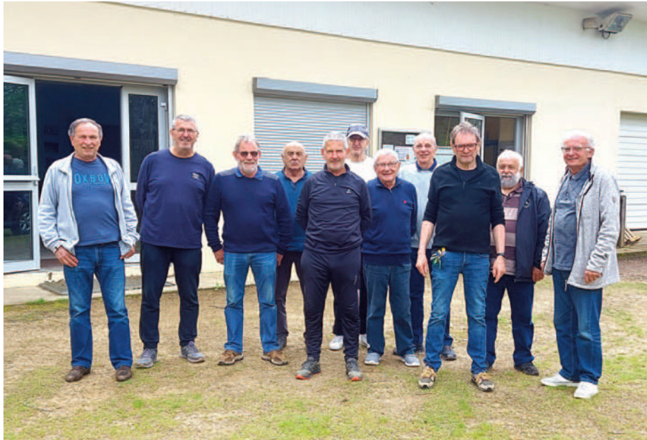
Les participants aux éliminatoires du challenge 2023