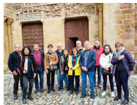
Au pied du tympan de l'abbatale à Conques

Dans la continuité et pour clore cette journée, nous avons visité le Musée Soulages à Rodez, où nous avons découvert les tableaux et l'esprit du Maître de l'Outreñoir grâce à un guide passionné.