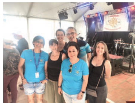
Retrouvailles entre collègues