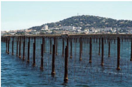
Parc à coquillages de l'étang de Thau