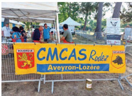
Notre stand toujours bien représenté