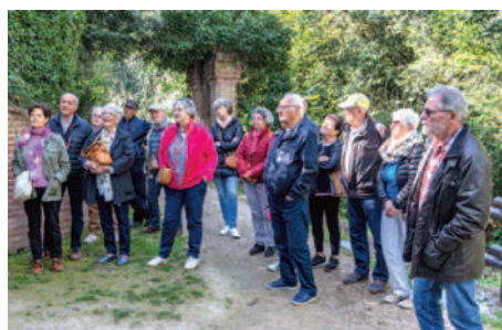
Le groupe attentif aux explications du guide