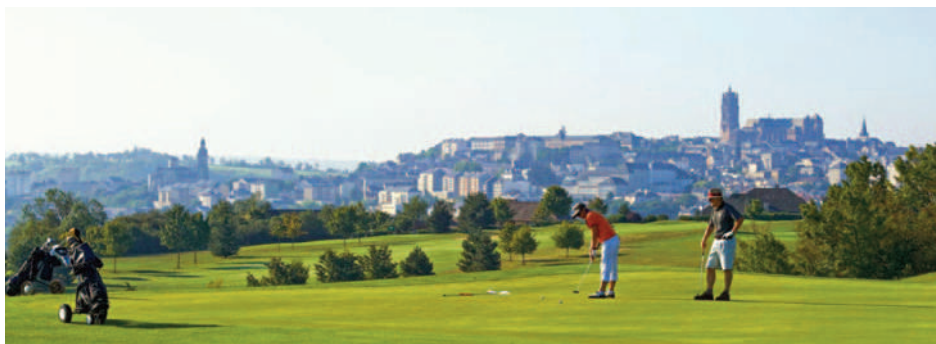
Le green de Rodez

Lors de nos échanges entre membres de notre section nous faisons régulièrement le constat d'un manque d'information et de reconnaissance sur l'existence d'une section golf au sein de notre SLVie.