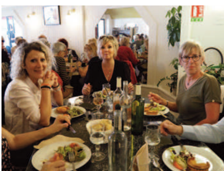
Les filles de la CMCAS