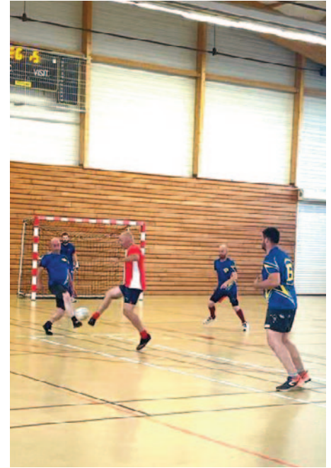
Soir de match

Le Futsal est un sport collectif apparenté au football, avec ses règles spécifiques.