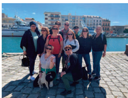
Les filles de l'acheminement Grdf