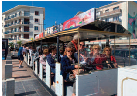
Visite de Sète en petit train