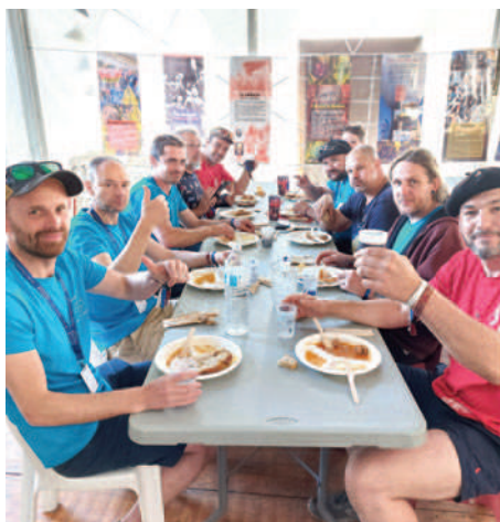
Pause et restauration pour nos bâtisseurs