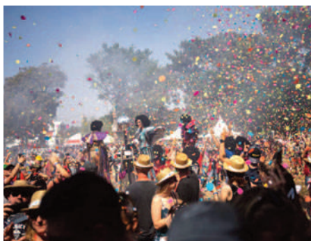
Des animations colorées