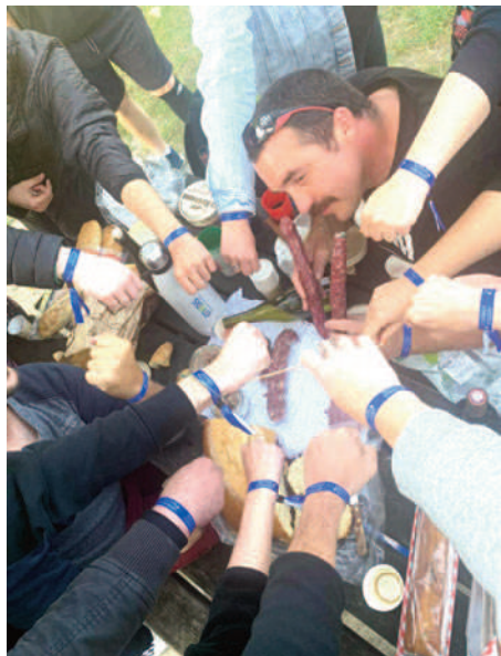
Un pour tous et tous pour le Festival !