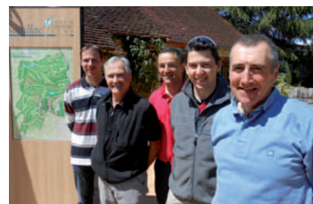
Les membres de la section Golf

Maintenant que vous savez qu'il existe une section golf à la CMCAS de Rodez, n'hésitez plus... joignez-vous à nous, vous êtes les bienvenus !