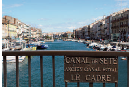
Aussi appelée la « Venise du Languedoc »