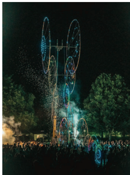
Jeux de sons et lumières