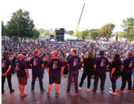
Les organisateurs saluent les festivaliers