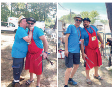
Dans une ambiance bon enfant