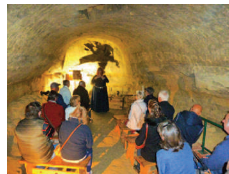
Dans les souterrains du château de Castela